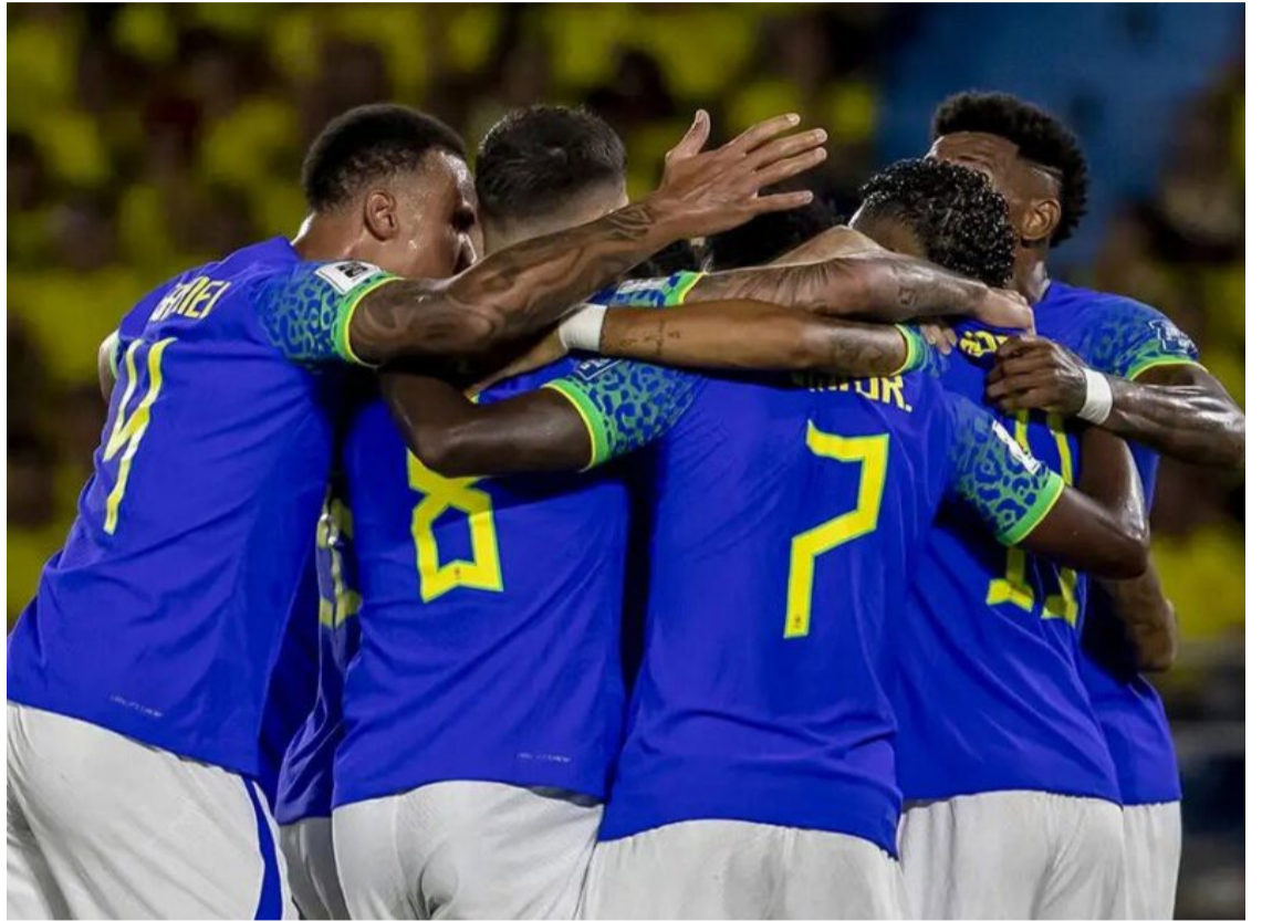
Brasil enfrenta a seleção peruana nesta terça-feira (15), no Mané Garrincha, em Brasília, pela 10ª rodada das Eliminatórias da Copa

Apesar da troca, Dorival elogiou o trabalho de Danilo como capitão da equipe. "Se a gente perceber, a primeira convocação tinha todos na mesma condição, início de temporada, não sabíamos quem atuava. Atrasamos quatro ou cinco dias o anúncio pela rodada no fim de semana. Ali percebemos que alguns iniciaram e outros não. Nesse processo todo, Danilo jogou duas vezes pela seleção, um jogo inteiro e outros entrando. Nas 10 partidas anteriores foi capitão da seleção. Eu agiria de má fé se desconvocasse ele por não atuar. Danilo tem importância interna, o que representa no grupo. Às vezes fechamos o olhos e só vemos o rendimento. Ele nun-