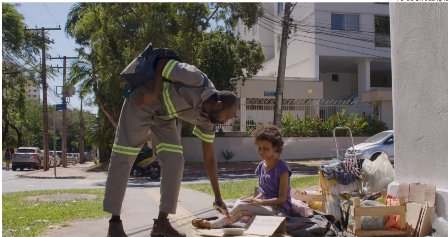
Basta abrir a janela: filme goiano retrata realidade brasileira que está presente em todos os lugares da esfera pública

Com notas claras do cotidiano brasileiro, o curta-metragem