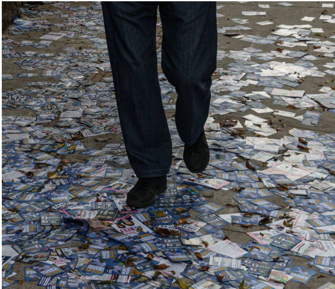
Gastos com "santinhos" e "colinhas" não são novidade e se mantêm no topo da lista das campanhas

Ramos afirma que as redes sociais têm força para candidatos com uma bandeira clara ou que são impulsionados por um padrinho político forte. Os panfletos, para ele, torna-