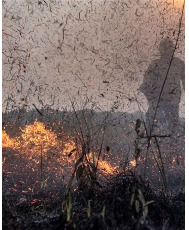
Cerrado é o segundo bioma mais afetado em números absolutos com 32,1%

Com mais de 2,3 mil focos de incêndio detectados nas últimas 48 horas, o Brasil já acumula este ano até o domingo (13), 226,6 mil registros detectados pelo Programa Queimadas do Instituto Nacional de Pesquisas Espaciais (Inpe)