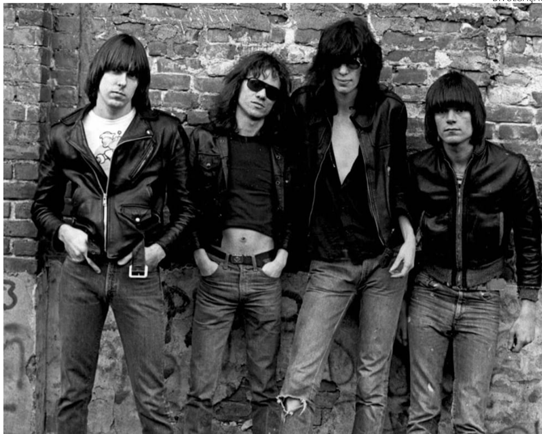
Grupo revolucionou rock nos anos 1970 com batidas aceleradas e sonoridade crua

Ouçó “Halfway to Sanity”, o disco lançado em 1987 pelos Ramones, pois retorna às lojas brasileiras (as virtuais e as que ainda funcionam nas cidades) —e no ultrapassado formato CD. É o último registro fonográfico com Richie Ramone na bateria, antes de o grupo estadunidense chamar ex-Blondie Clem Burke para impiedosamente tomar-lhe as baquetas.